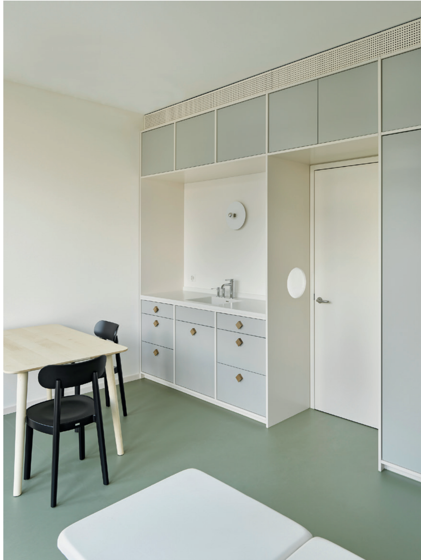
Medarium, Praxis für Notfall- und Hausarztmedizin, 2022 Sursee Farbkonzept im Innenraum In Zusammenarbeit mit Kunzarchitekten, Sursee