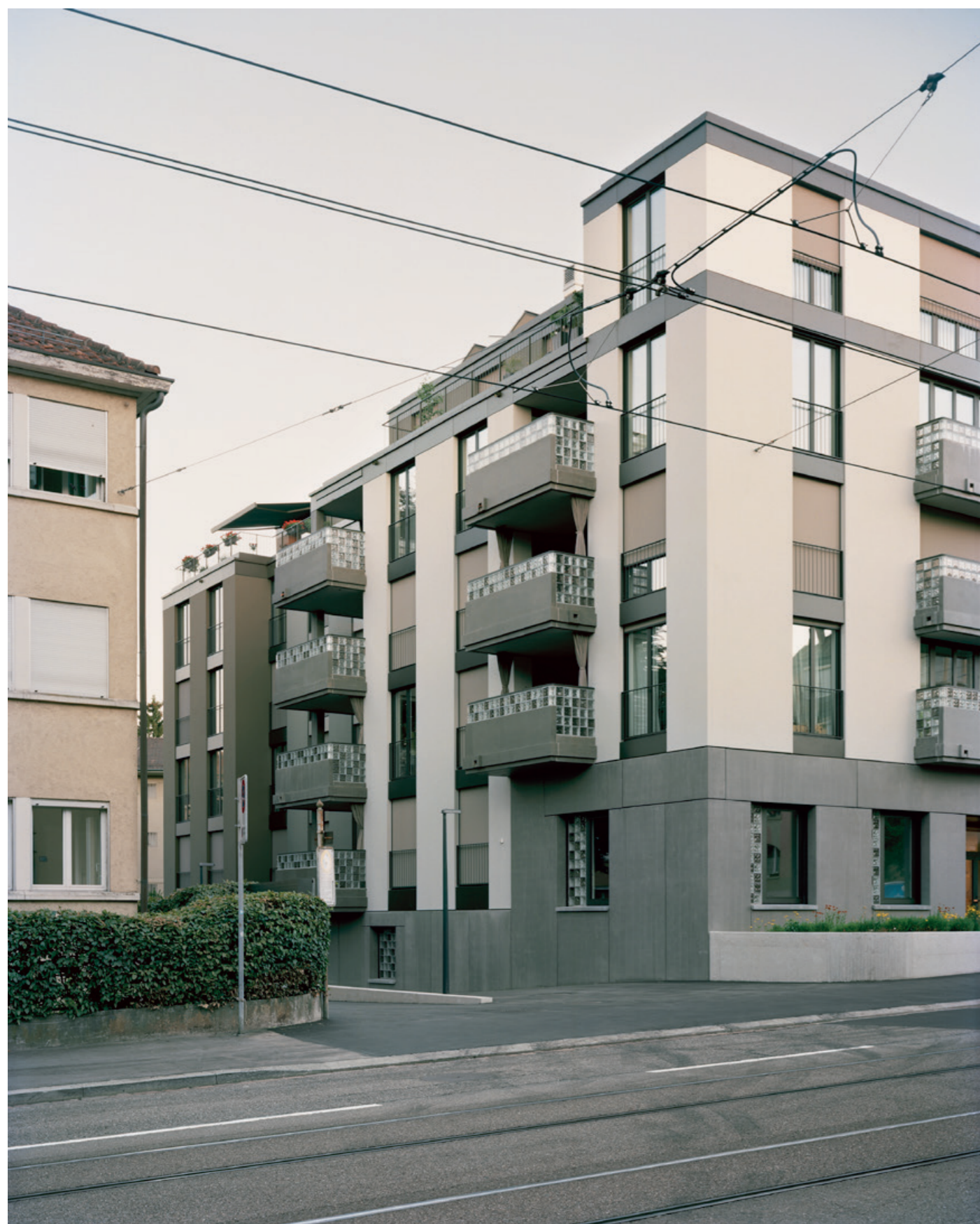
Lueg id Stadt, 2019 Überbauung, Zürich Farbkonzept der Fassade In Zusammenarbeit mit Blättler Dafflon Architekten, Zürich