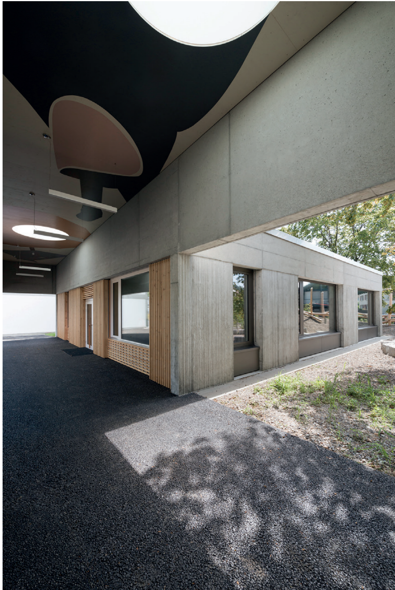
Abtauchen, 2016 Kindergarten, Aarau Farbkonzept im Innenraum Deckenbild im Aussenraum In Zusammenarbeit mit Mai Architektur, Luzern